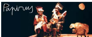
PAPIRUS a partir de 4 anys / sala ó carrer