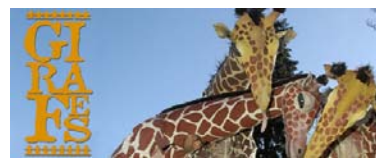
GIRAFES per tota la família / carrer